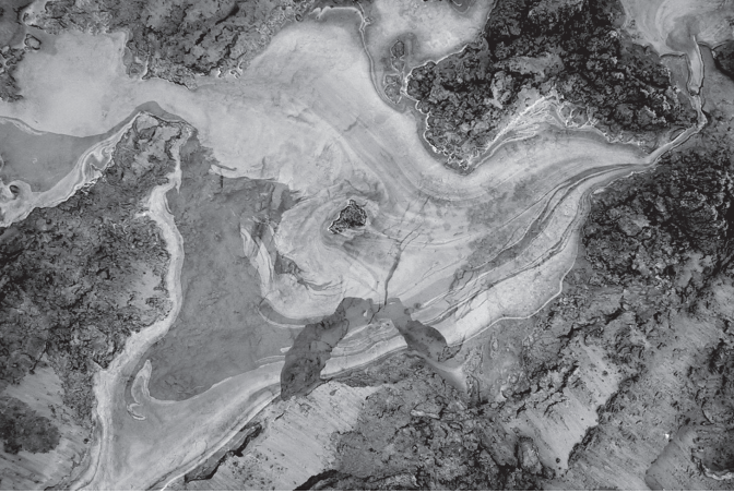
Wasser, Bild: J. Abrecht, Geotest AG

cient construction of infrastructures in difficult geological situations.